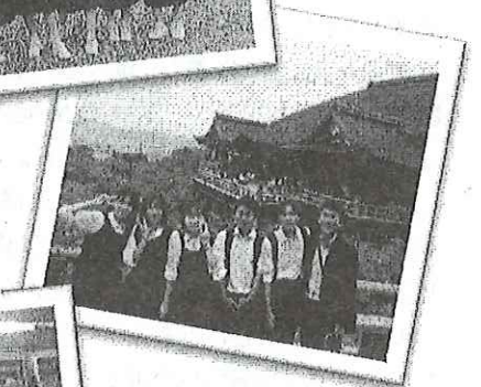
←伏見稻荷大社 にて