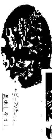
→EGチソナリ 美味しそう!