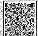
【埼玉県総合教育センター】