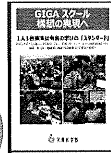
GIGAスクール構想の実現へ(リーフレット)

学習者用の1人1台端末と、高速通信ネットワークを一体的に整備することで、多様な子供たちそれぞれに最適な学びを実現するために、国が進める教育政策です。